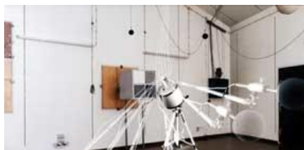
ERENJA PRIGUŠIVAČA ZVUKA KUSTIKA