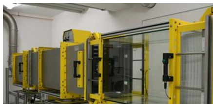
NAJSTROŽIJE ZAHTEVE TEHNIKA