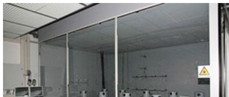
ISPITNA POSTROJENJA TEHNOLOGIJA DISTRIBUCIJE VAZDUHA