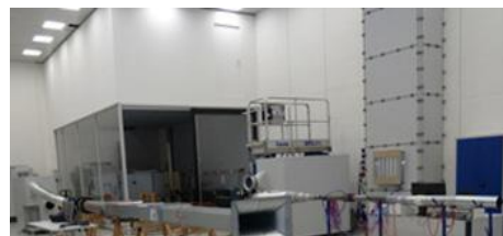
ISPITNA POSTROJENJA REGULACIONA TEHNIKA