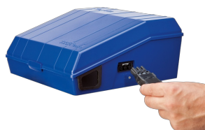
CONNECTION SOCKET FOR LIGHTING