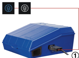
BUTTONS ON THE CONTROL PANEL TO SWITCH THE LIGHTING ON/OFF