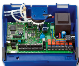
EASYLAB CONTROLLER TCU3