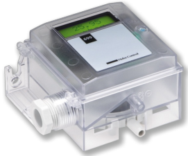
DIFFERENTIAL PRESSURE TRANSDUCER 699